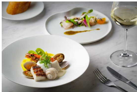
シグネチャーコース イメージ

四季折々の旬な長崎食材と和・華・蘭の技法を取り入れた、イノベーティブなフュージョン料理を提供。シグネチャーコースの「Blanche」をはじめ、長崎の食の魅力をも堪能するクリエイティブな料理の数々をお楽しみいただけます。